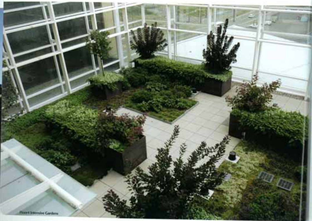
Plant Intensive Gardens