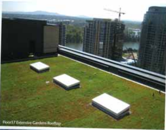
Floor 17 Extensive Gardens Rooftop