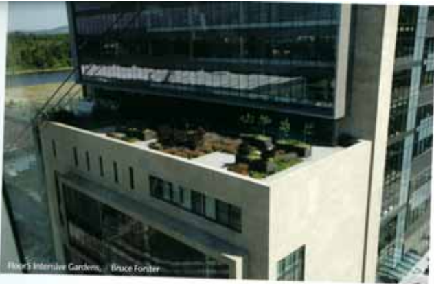
Floor 5 Intensive Gardens, Bruce Forster