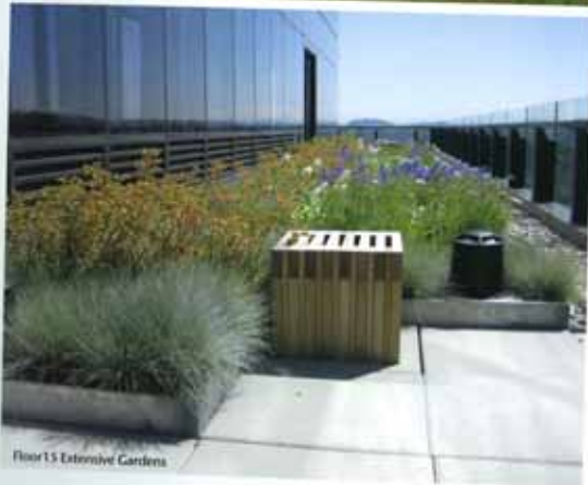
Floor 15 Extensive Gardens