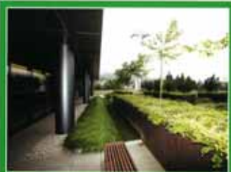
Location: Portland, Oregon, USA Landscape Architecture: Walker Macy

Oregon Health Sciences University (OHSU) decided to expand their urban campus to the nearby South Waterfront Urban Redevelopment District. As the first building to redevelop in the old industrial neighborhood, the Center for Health and Healing (CHH) targeted high performance and civic responsibility. The Center provides OHSU with laboratories, educational spaces, medical offices, and surgery suites. The building's public uses also include fitness and wellness center, pharmacy, cafe, retail space, and a public atrium.